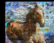
Le Cadeau Du Cheval The Horse Gift