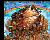
Wildlife ARK Earth's Treasure Chest