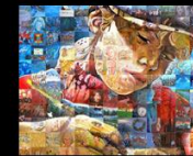
What Inspires a Child St. Albert Community Mural