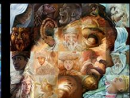
ADAM Unite the Nations