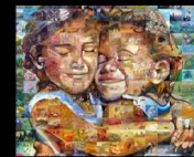
Buffalo Twins AB/SK Centennial Mural