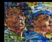
Mural of Honour