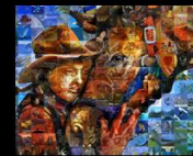
TRUST Town of Cochrane