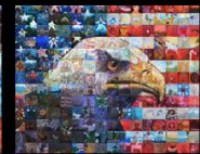
Freedom Flag Students of South Jordan, UT