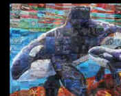
KUMAMOKSI Coastal Inspirations